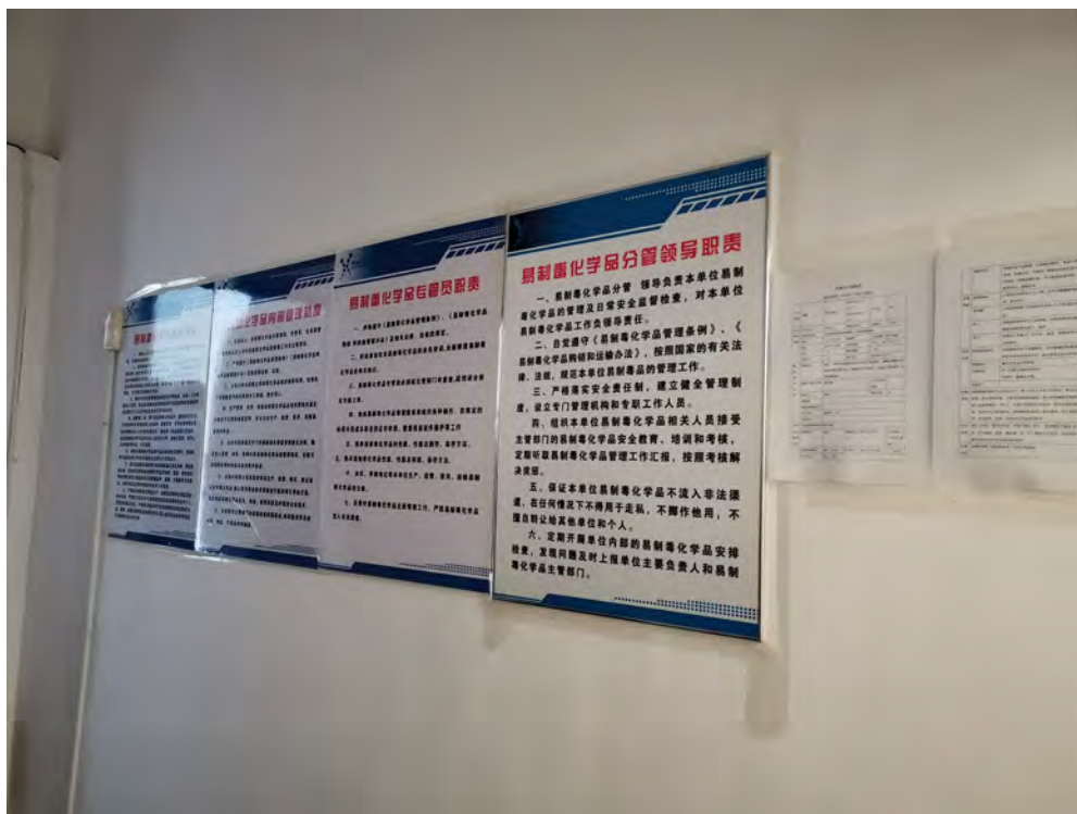
危险化学品仓库制度上墙