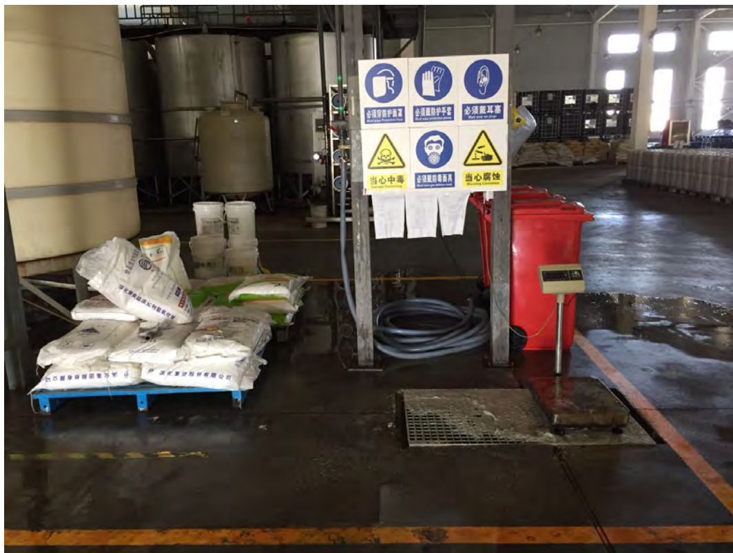
氢氧化钠储存、配置区域

(2) 氢氧化钠储存于生产车间南侧，车间地面进行硬化；储存和配置区域设有导流沟。